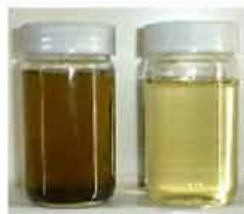
鉱油系油圧作動油濾過

\alpha セルロース繊維をトイレtpーパー状に巻き、外紙管圧入でエレメント下部を絞込み、濾過経路に密度勾配を持たせたフィルターを使用して、毎分 30L の濾過が可能です。エレメント精度は \beta_5=540 、 \beta_{10}=145 と選択でき、フィルター1個当り 200cc の水分吸着 (200 cc \times 5 個 = 1000 cc) が可能です。