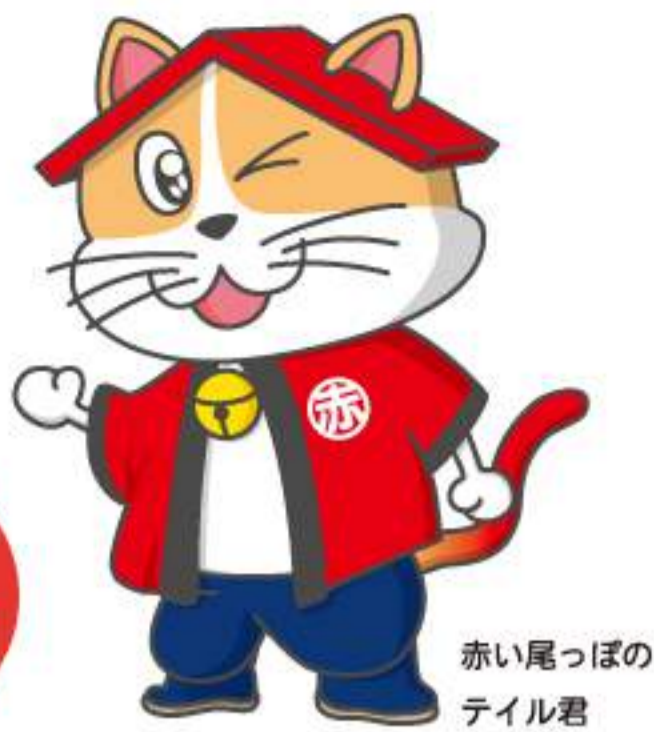
赤い尾っぽの テイル君